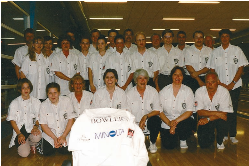
1997/1998/1999 klubben fik nye spilletrøjer. Sponsor var Minolta, Øens Vinagentur og Svaneke Bolcher

hit er natbowling. At spille natbowling vil sige, at der kun er lys helt nede ved keglerne og intet lys på selve banen.