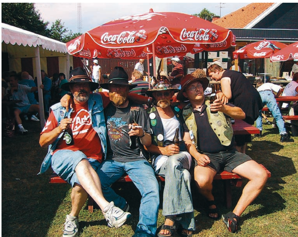
Loppemarkedet har udviklet sig til en folkefest med gæster fra ind- og udland.

om måneden, oprydning og sortering en gang om måneden, altid i godt humør og med gåpåmod, uden jer og vores altid villige og flinke chauffører, kunne alt dette slet ikke lade sig gøre. Alt dette er også et godt stykke socialt arbejde, hvor de »gamle« mødes og drøfter dagligdagen og verdenssituationen.