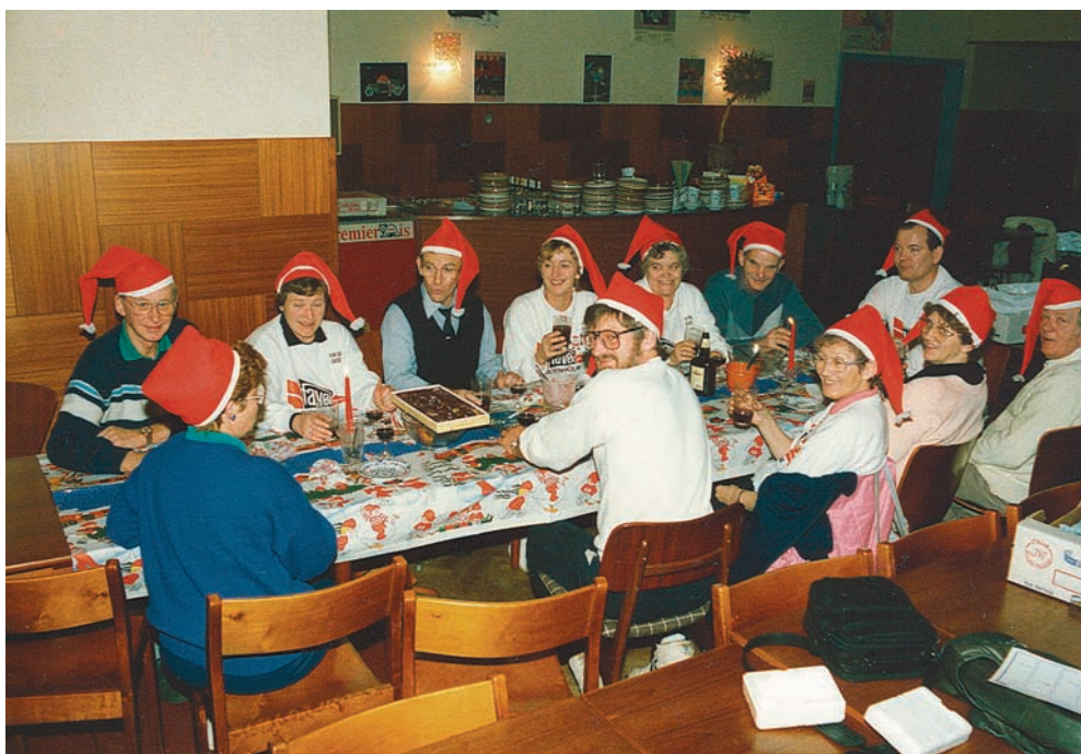
Julehygge i 1988 efter Torsdagsbanko på Strien.

Støtteafdelingen har dog ikke kun »afgivet« nogle aktiver, vi har også modtaget, nemlig vores juletræsfest for de små og andre barnlige sjæle. Dette var oprindeligt i gymnastikkens regi, men da det efter en årrække knob med at få hjælpere, fik vi tilbudet om at overtage dette. Det gjorde vi med stor glæde, og det er et arrangement vi glæder os til at stable på benene hvert år. Så tak til gymnastikken for dette.