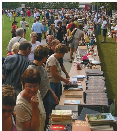
Bogudsalget er altid et tilløbsstykke på IK Vikings loppemarked.